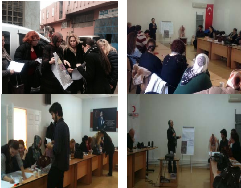
Şekil 1. Tuzla ilçesinde mahalli risk tespit saha ve masa başı çalışmaları (Okay ve diğ. 2014).

Kadınların planlama süreçlerine katılımının sağlanması, sosyoekonomik kapasite güçlendirme eğitimlerinin yanısıra afet eğitimi, acil eylem planlarına yönelik tatbikat ve tahliye eğitimlerinin de verilmesi gerekir. Bu kapsamda, yerel ve gönüllü organizasyonların kadının toplumsal rollerine ve sosyal kapasitesine yönelik verdikleri eğitimlerin genellikle tek yönlü bilgi akışı şeklinde olduğu gözlenmektedir (Takeuchi ve diğ. 2012; Okay ve diğ. 2014; 2016). Sadece riske yönelik tek-yönlü bilgi verilmesi yeterli olmamaktadır. Halkın kapasitesi, ihtiyaçları ve görüşlerinin anaakımlaştırıldığı bir risk iletişimi yaklaşımı daha başarılı olacaktır. Bu bağlamda, İstanbul'da İSKA tarafından desteklenen Tuzla İlçesi Afet Risk Yönetiminin Geliştirilmesi Projesi kapsamında toplumsal risk yönetimi çalışmaları gerçekleştirilmiştir (Okay ve diğ. 2014). Kızılay, belediye ve üniversite işbirliğinde, temel afet bilinci eğitimleri verilmiştir. Yerel gönüllü kadın grubu ile zarar azaltma planlaması ve risk azaltma stratejileri geliştirilmesinde mahalle risk tespit ve stratejik planlama çalışmaları yürütülmüştür (Şekil 1). Bölgede yapılan bu uygulamalı eğitim, saha ve masa-başı çalışmalarla mahalli riskler değerlendirilmiştir. Böylelikle, yerel kadın organizasyonunun afetlere karşı sosyal anlamda dirençliliğin sağlanması ve geliştirilmesi için karar verme kapasitelerini arttırmaya yönelik katılımcı planlama çalışmaları gerçekleştirilmiştir (Okay ve diğ. 2014).